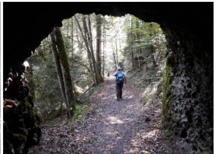
Wanderweg an der Sihl

Das Oetwiler Wanderleiterteam freut sich auf Eure Anmeldung und wünscht eine erholsame und beglückende Wanderung!